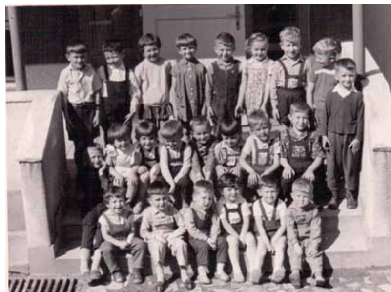
První absolventi mateřské školy - školní ročník 1964 - 65