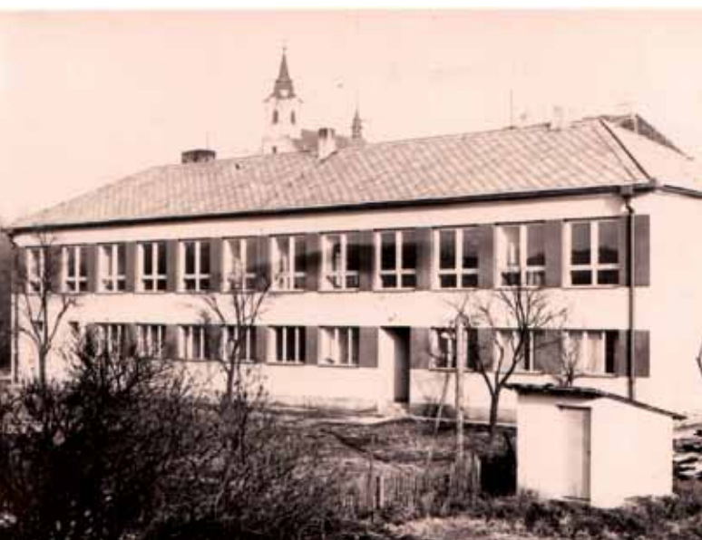
Mateřská škola po výstavbě - foto z roku 1964