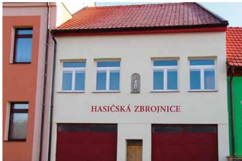
Hasičská zbrojnice po opravě