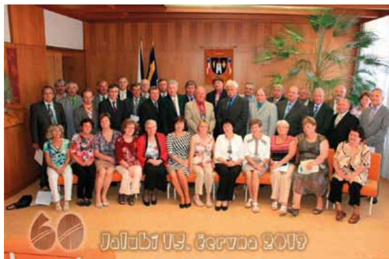
Setkání ročníku 1953