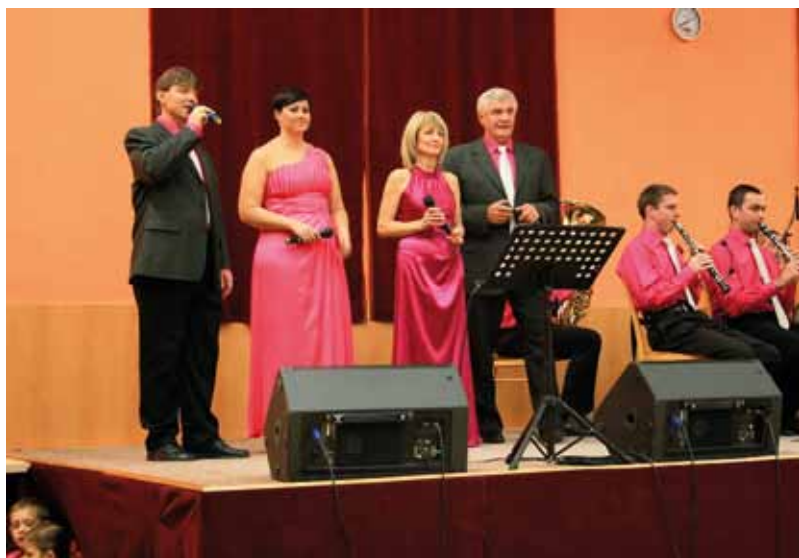
Vánoční koncert Stříbrňanky