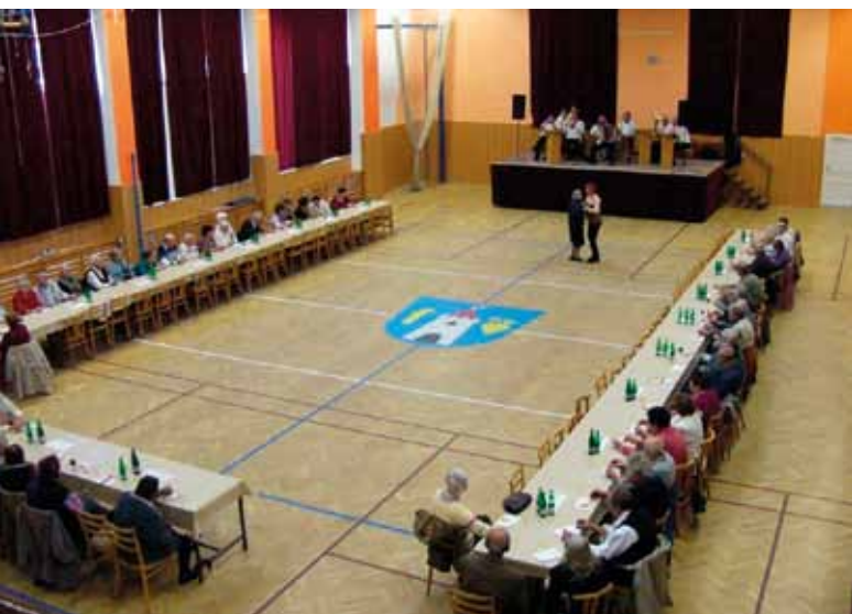
Beseda se seniory