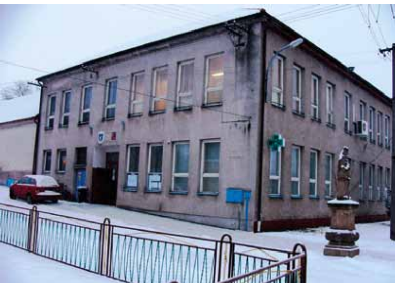
Obecní úřad před opravou