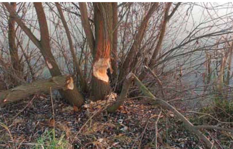
Kdopak si to u rybníka za Bařinkami chystá topení na zimu?