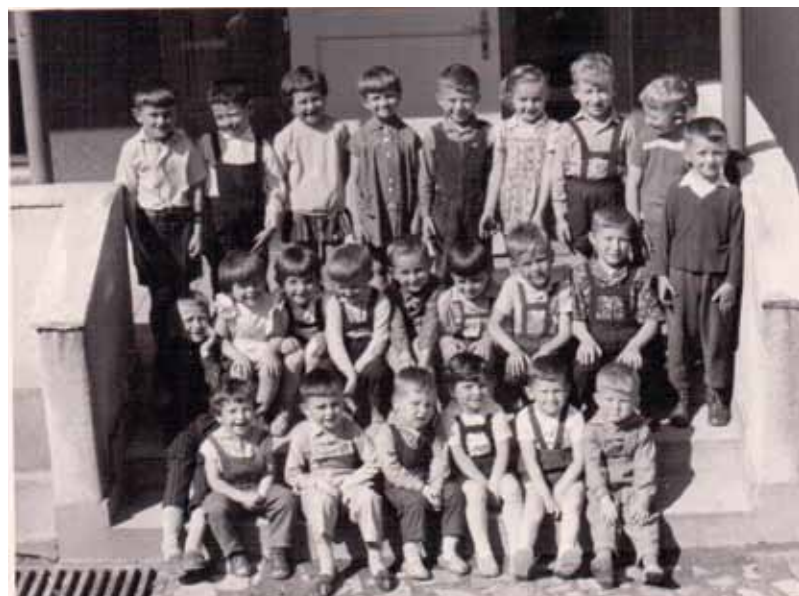
První absolventi mateřské školy - školní ročník 1964 - 65