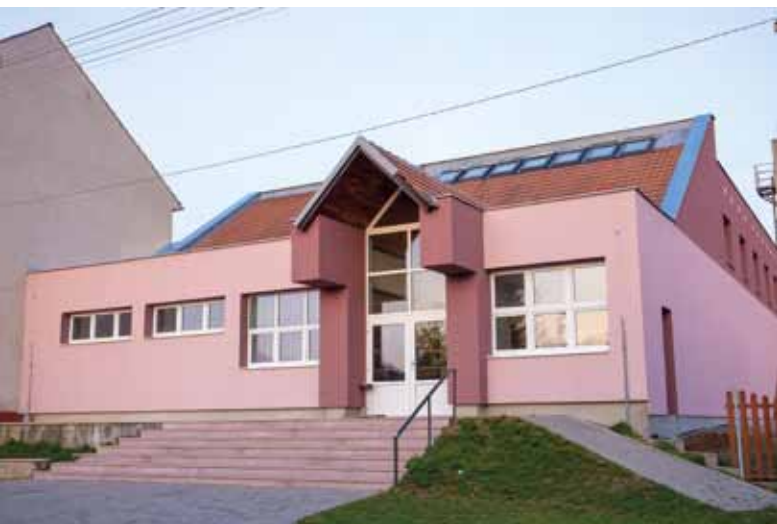
Rekonstrukce kulturního domu