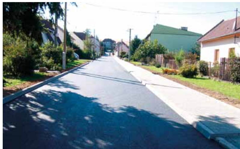
Rekonstrukce vozovky na Novém světě