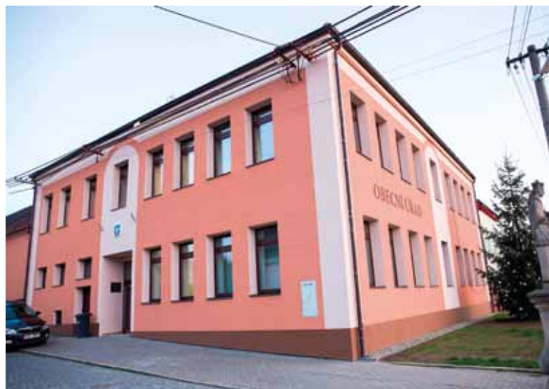
... a po opravě