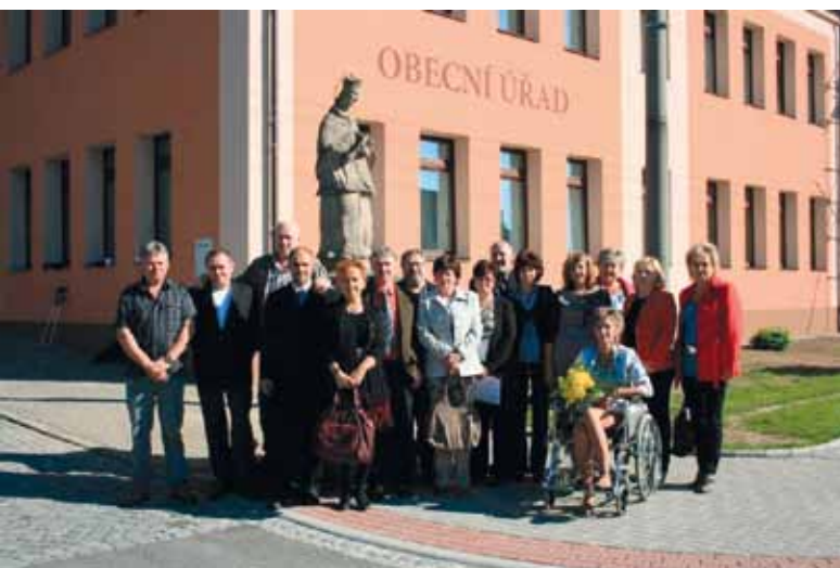
Setkání ročníku 1963