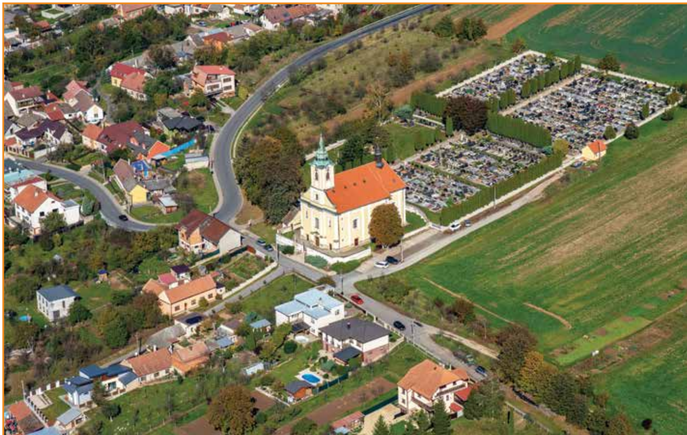
pohled na dominantu obce – kostel sv. Jana Křtitele ↑ × ↓ letecký pohled na obec