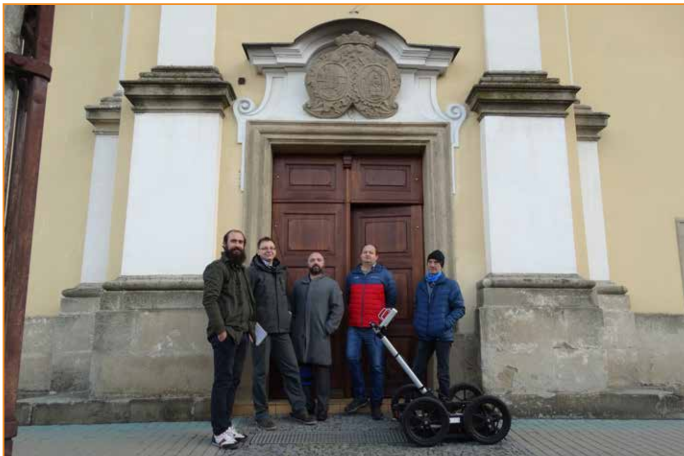
další fáze geofyzikálního výzkumu kostela \uparrow \times \downarrow z koštování vína 22. 2. 2020