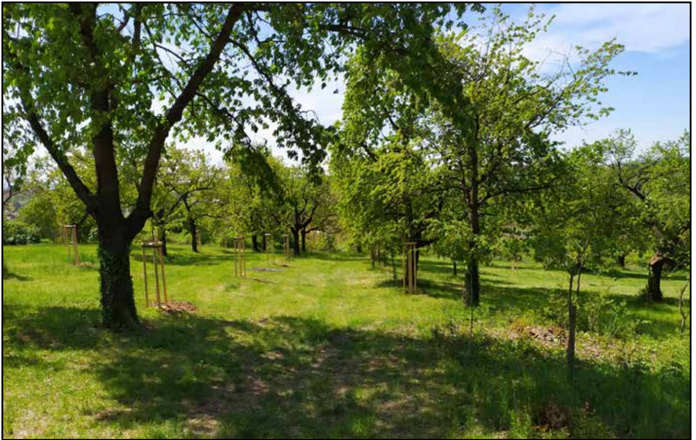
obnova třešňového sadu v Chrastce ↑ ✕ ↓ posezení u mlýna