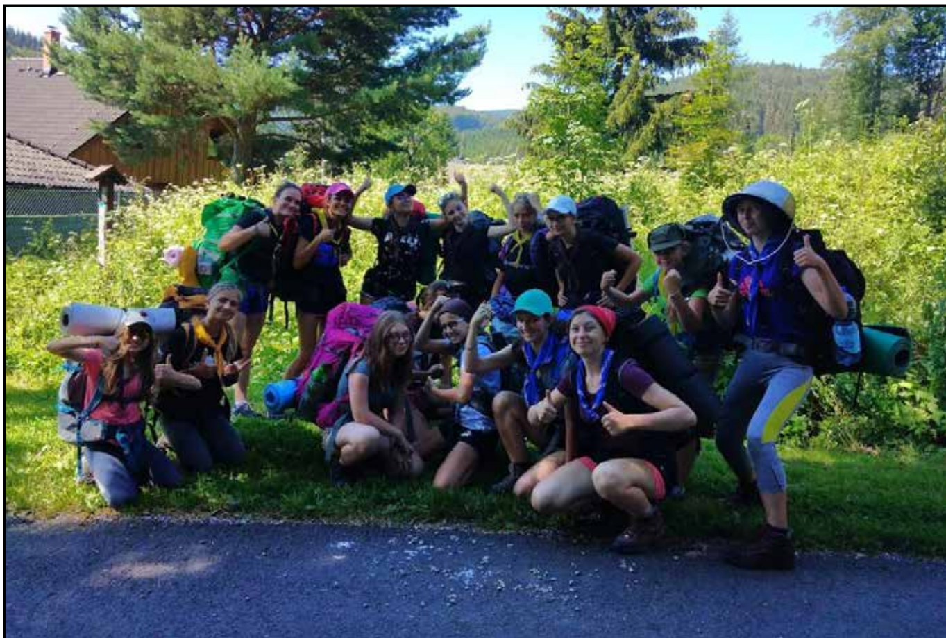
děvčata na letním táboře ↑ ✕ ↓ děkovaná mše za úrodu