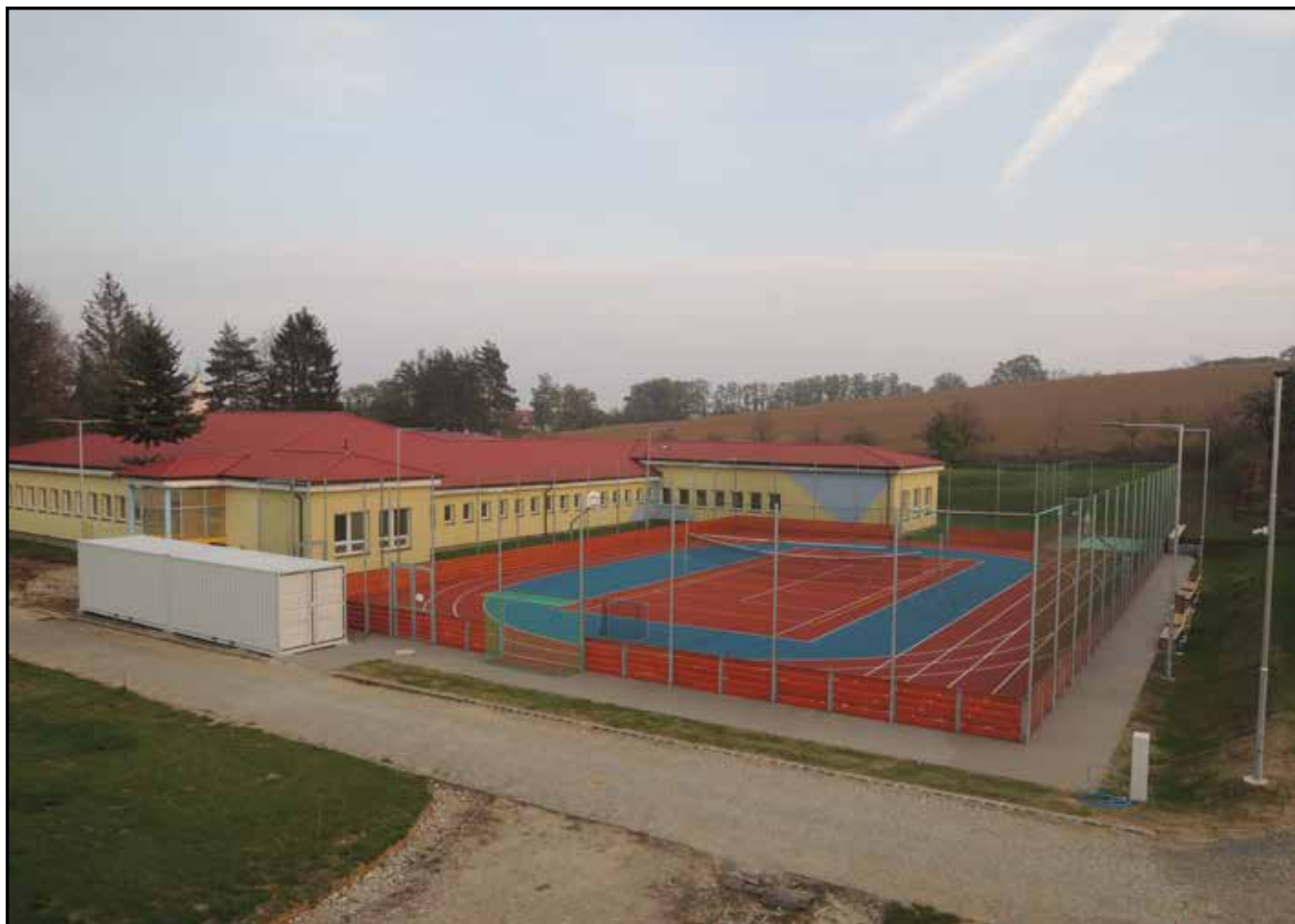
celkový pohled na multifunkční hřiště ↑ × ↓ ze sportovních aktivit na novém hřišti