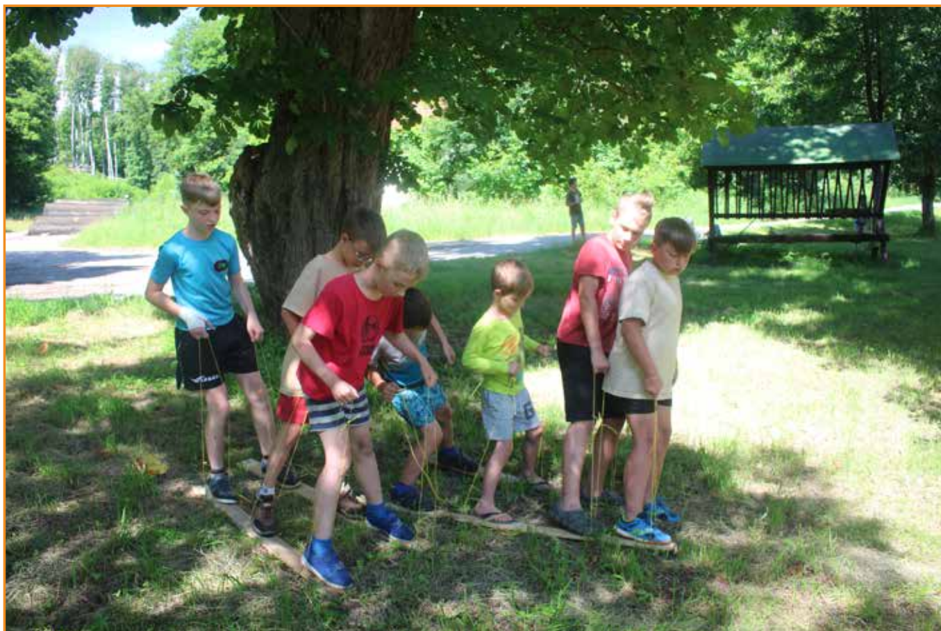
↑ vlčata na letním táboře ← mladí hasiči na výpravě do přírody ↓ skauti na letním putáku