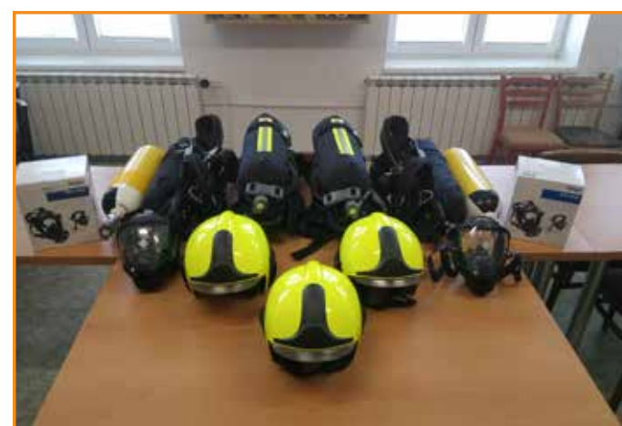
↑ nové vybavení pro hasiče