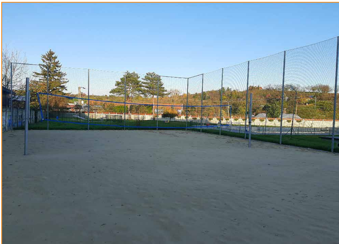
nové hřiště na koupališti ↑ × ↓ zalévání vysázených stromů v ekoparku na Bařinkách