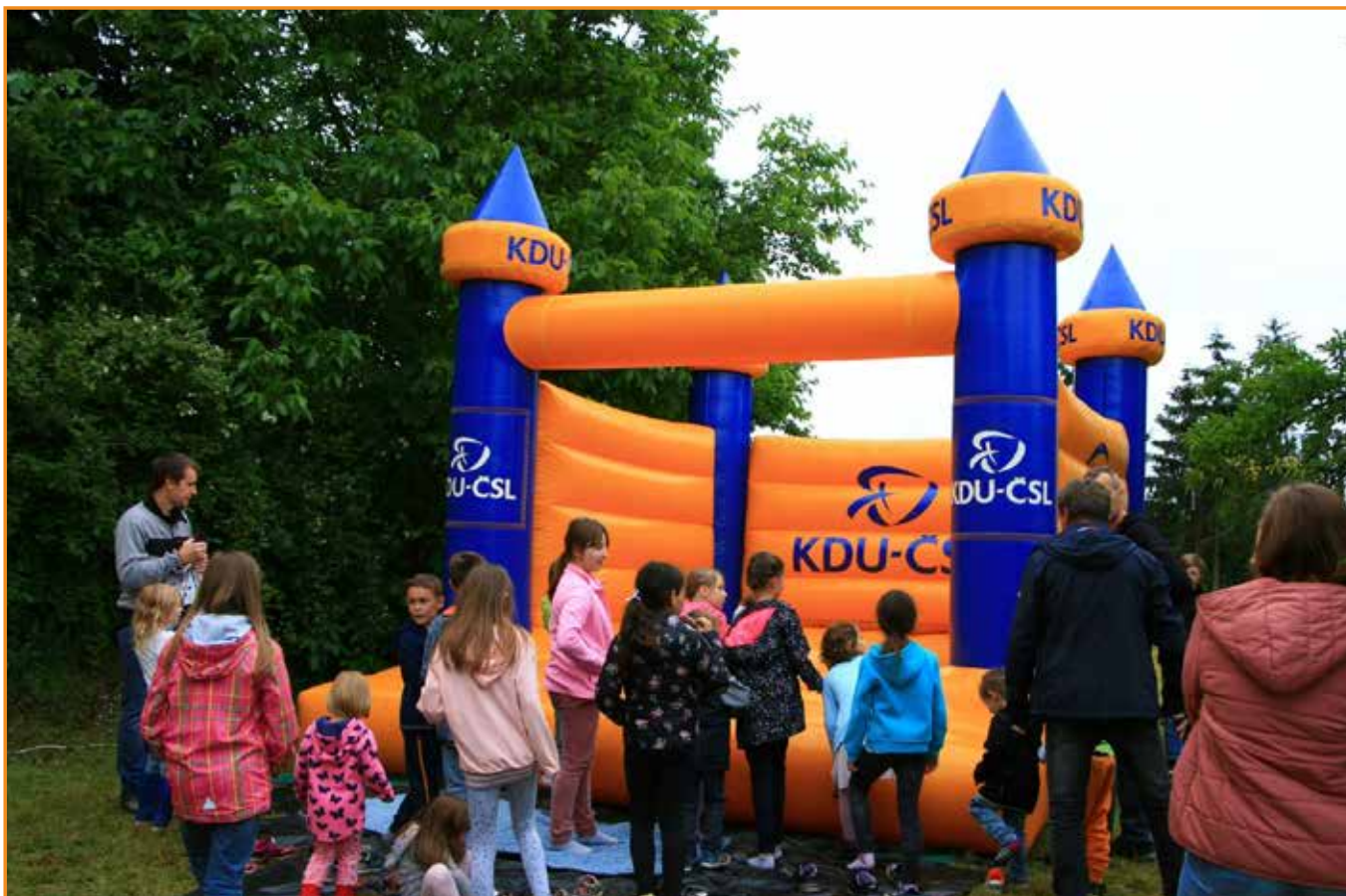
farní den † ✕ ‡ vánoční koledování