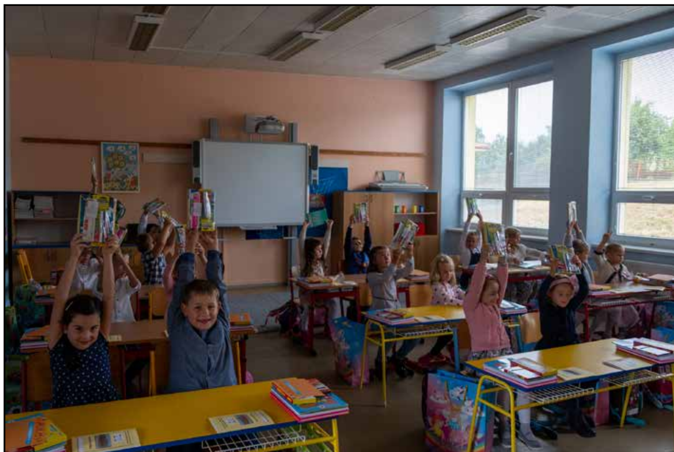
přijetí prvňáčků 1. 9. 2020 ↑ × ↓ setkání jubilantů 26. 6. 2020