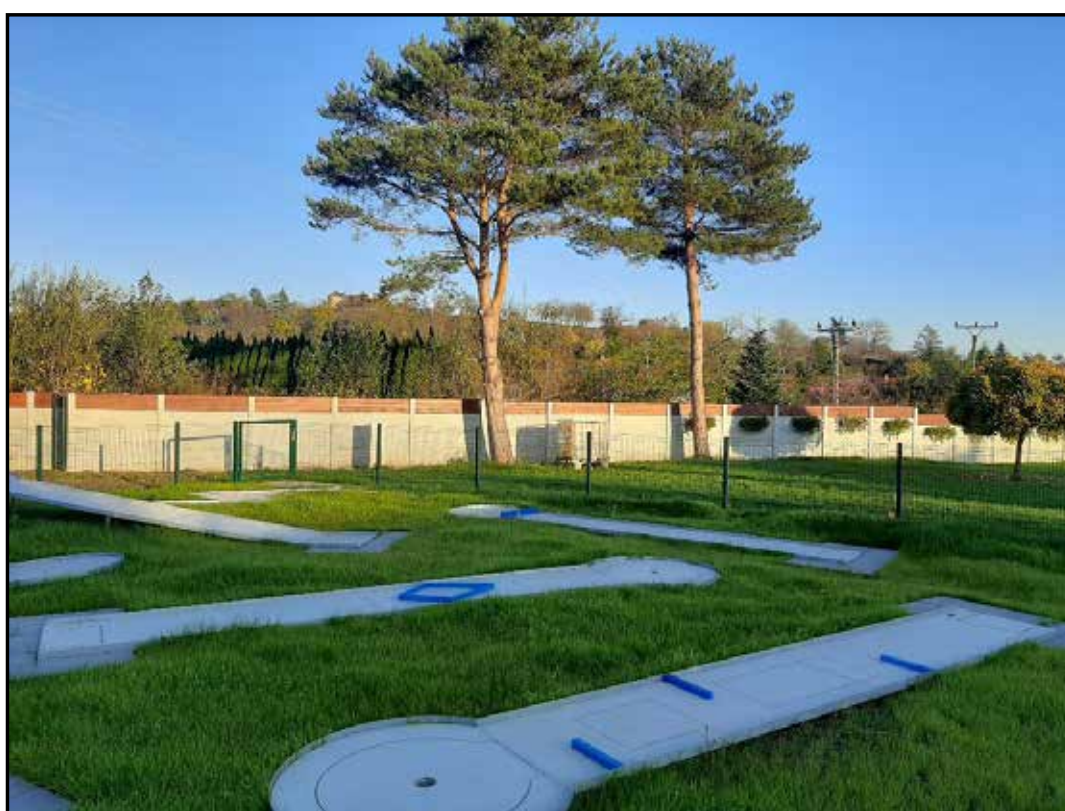
minigolf na koupališti po realizaci ↑ × ↓ před realizací