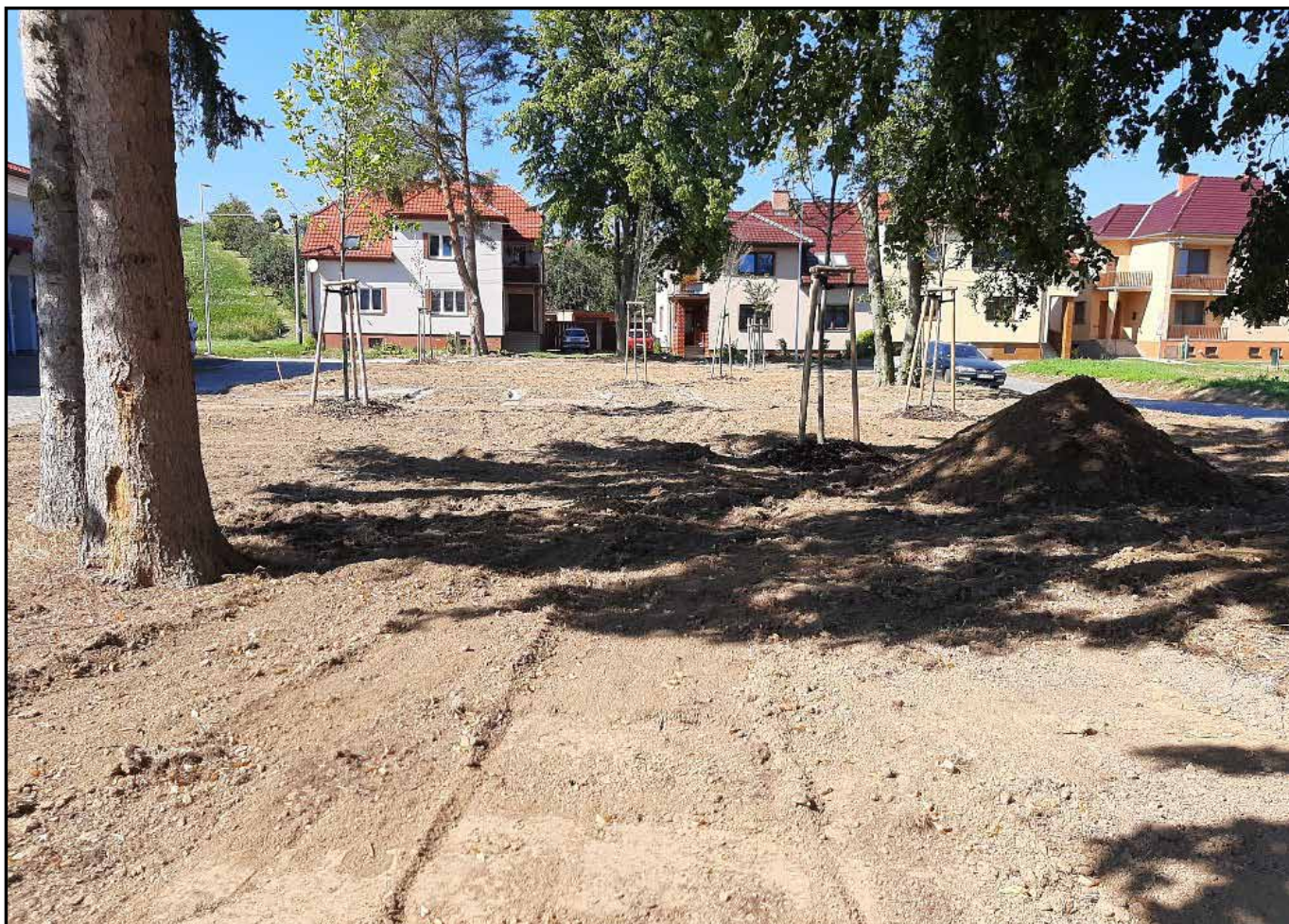
úprava plochy před školou ↑ × ↓ po realizaci