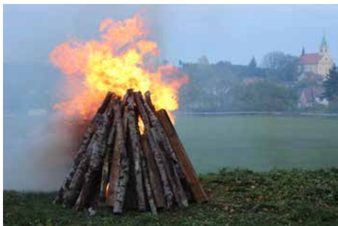
Vatra zapálená u příležitosti oslav 100. výročí založení republiky