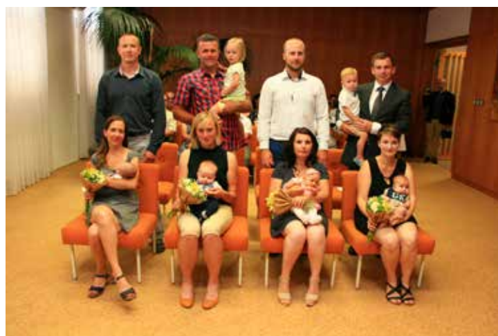
Vítání občánek 1. 6. 2018