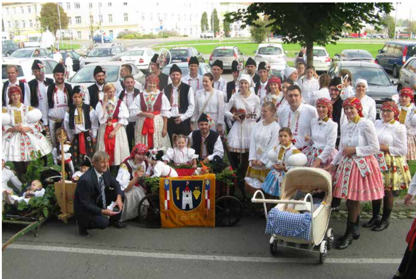
Ze slavností vína 2018