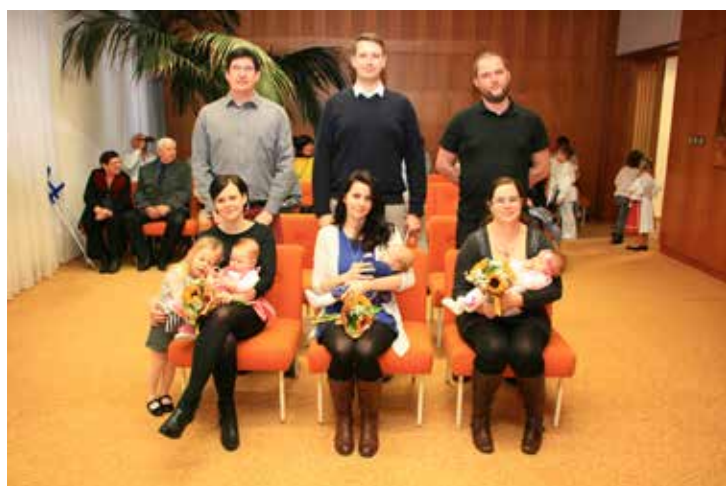
Vítání občánek 2. 3. 2018