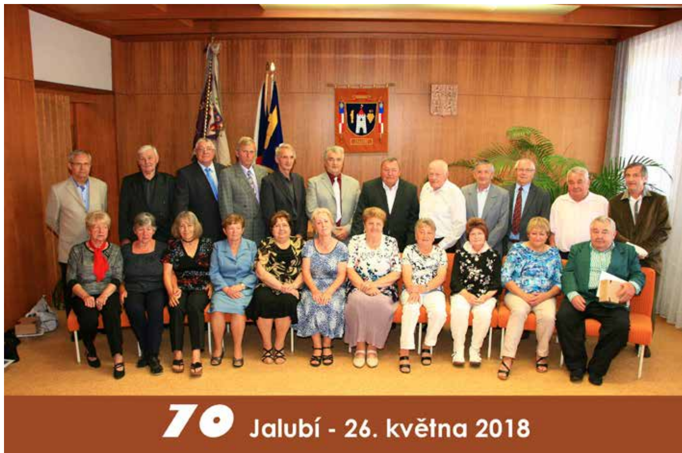
Setkání ročníku 1948