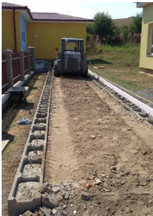
Propojovací chodba (krček) v základní škole před a po dokončení