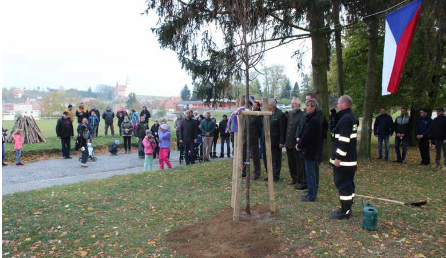
Lípa republiky vysázená 28. října 2018