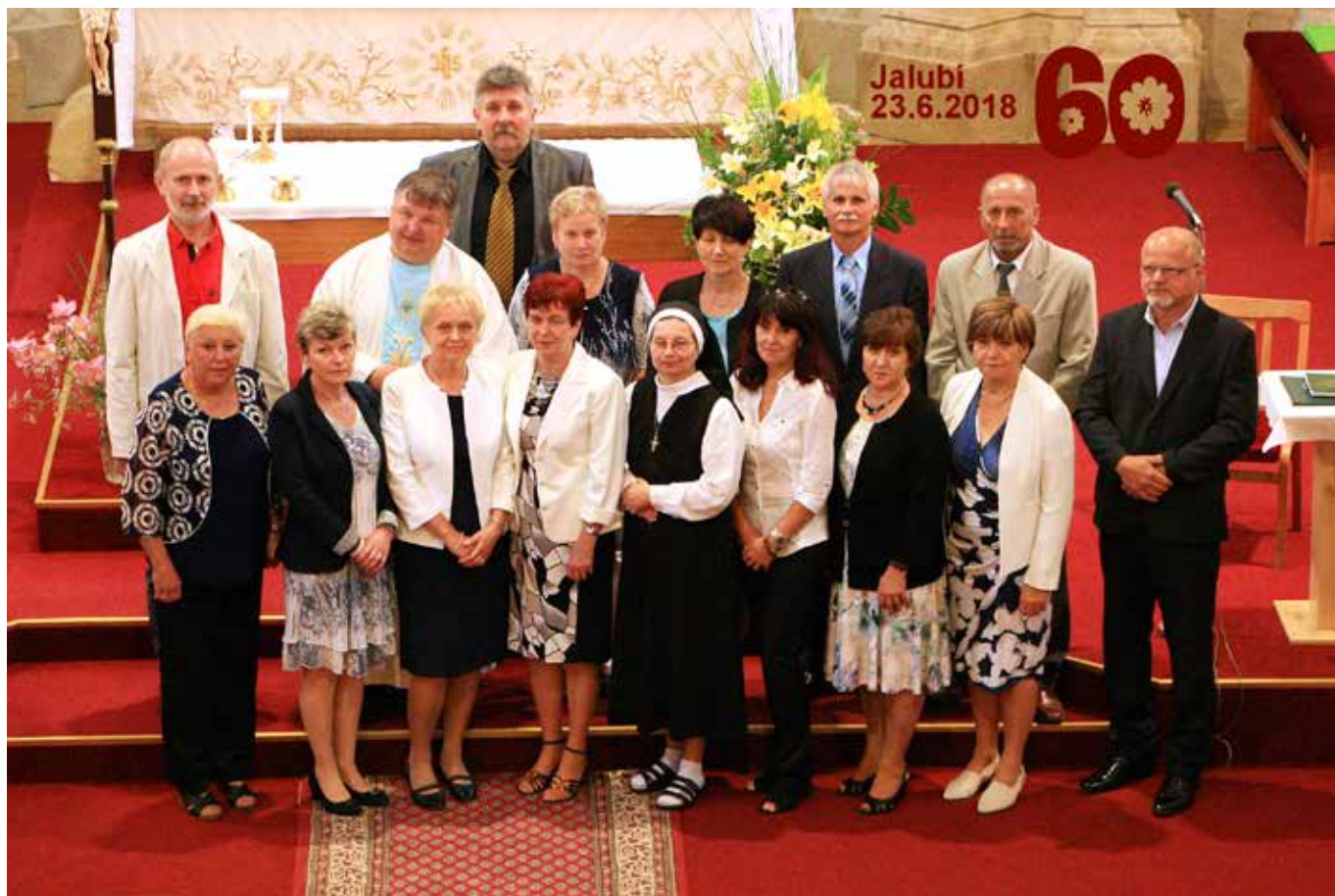
Setkání ročníku 1958