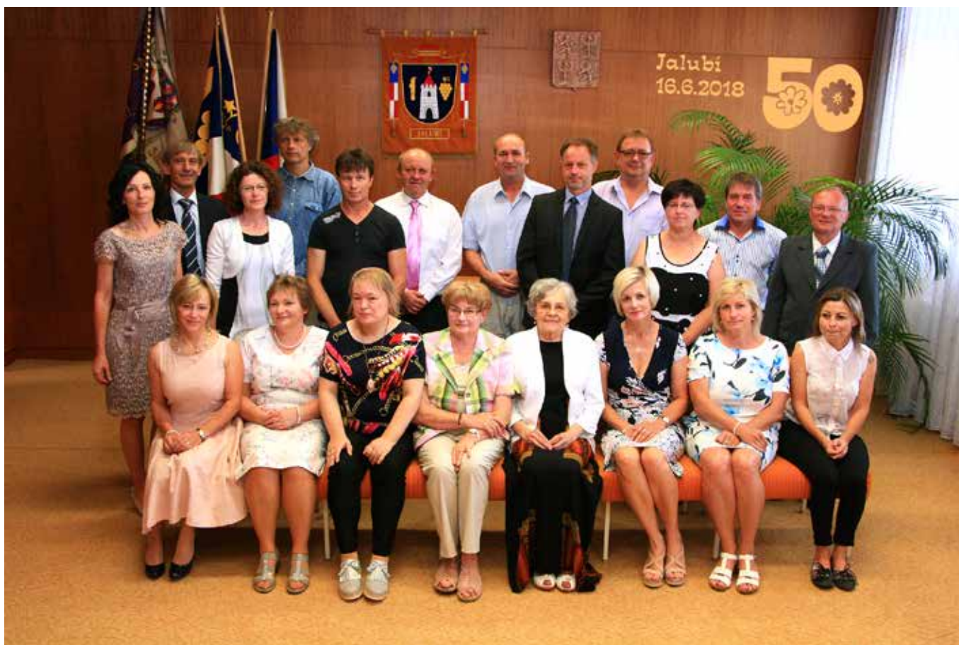
Setkání ročníku 1968