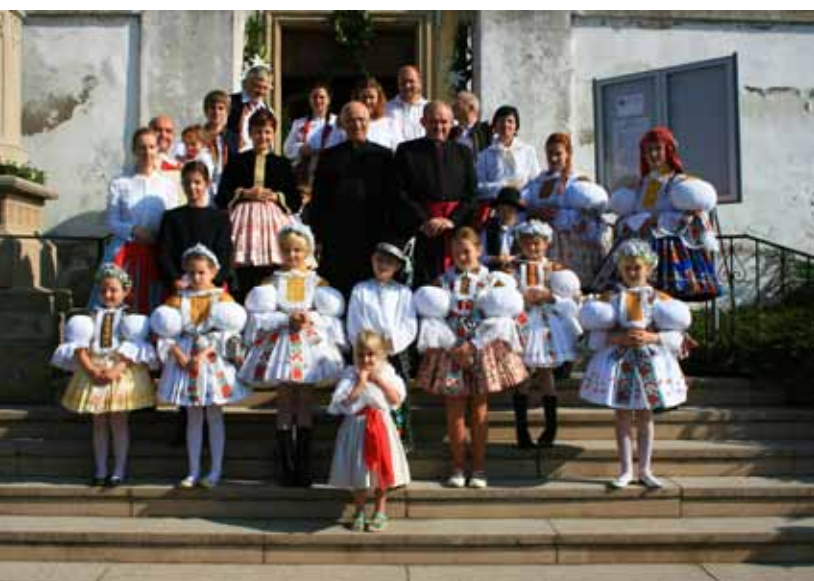
Oslava 250 let od žehnání kostela