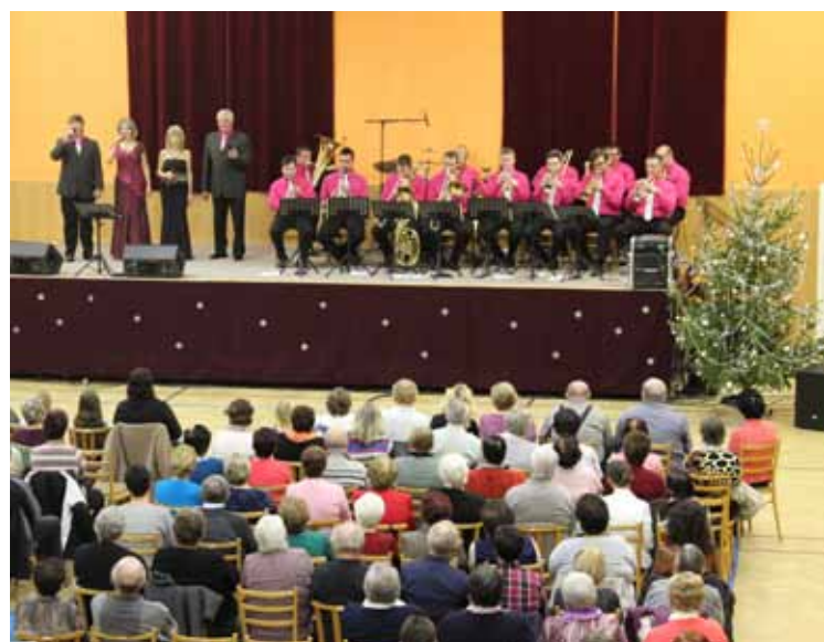
Stříbrňanka - vánoční koncert