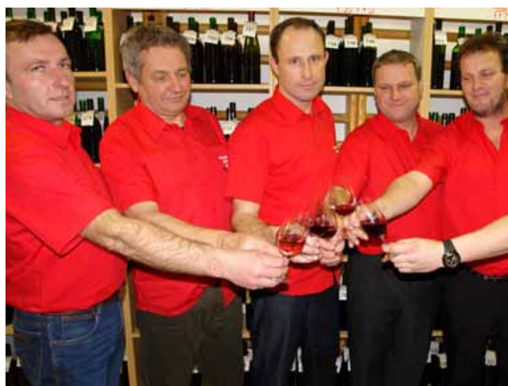
Přátelé vína letos nabídli ke koštování více jak 800 vzorků vína