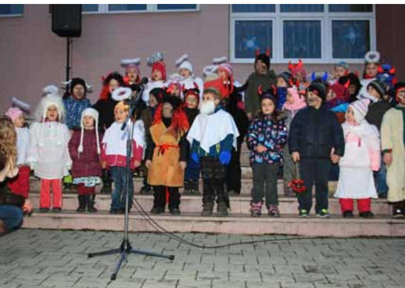
Vystoupení dětí z MŠ při rozsvícení vánočního stromu