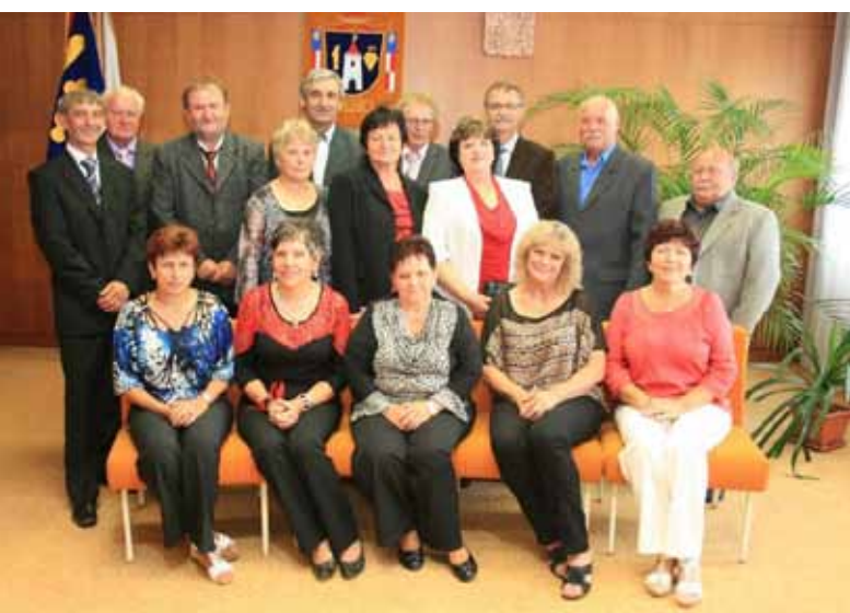
Setkání ročníku 1954