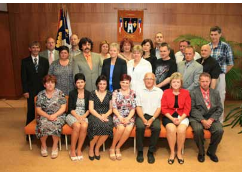
Setkání ročníku 1964