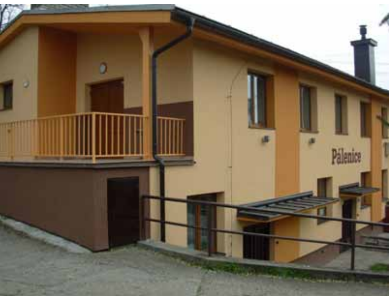
Klubovna zahrádkářů s novou fasádou