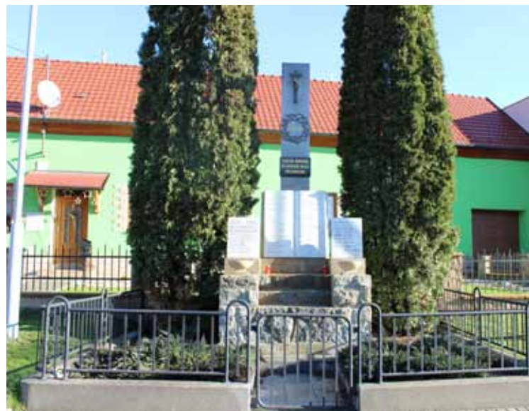
Památník padlých po restaurování v měsíci říjnu 2014