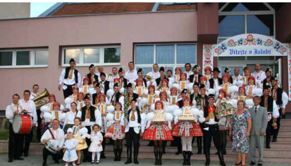
Letošní hodová chasa před kulturním domem.