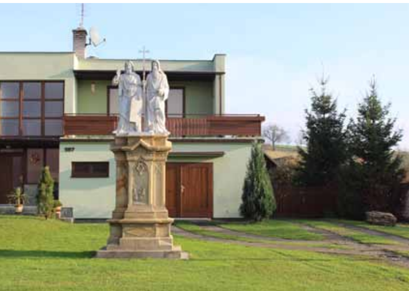
Sousoší Cyrila a Metoděje po opravě v říjnu 2014