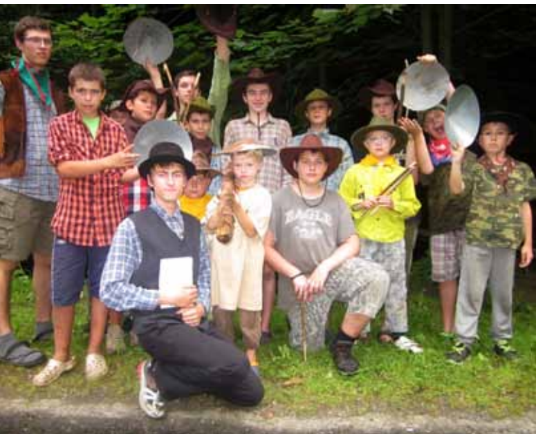
Tábor - chlapecký oddíl