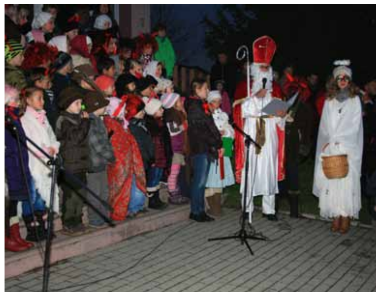
... i čert přišel