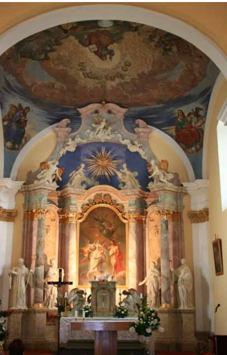
Retábul kostela po opravě

Podíl jednotlivých složek veřejné správy a samosprávy na finanční pomoci nejlépe ukáže tabulka vlevo.