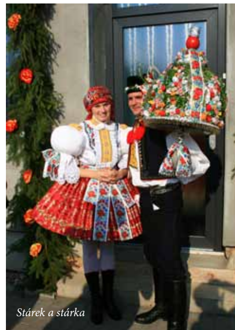
Stárek a stárka