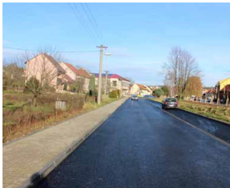
Nová silnice za potokem - prosinec 2014