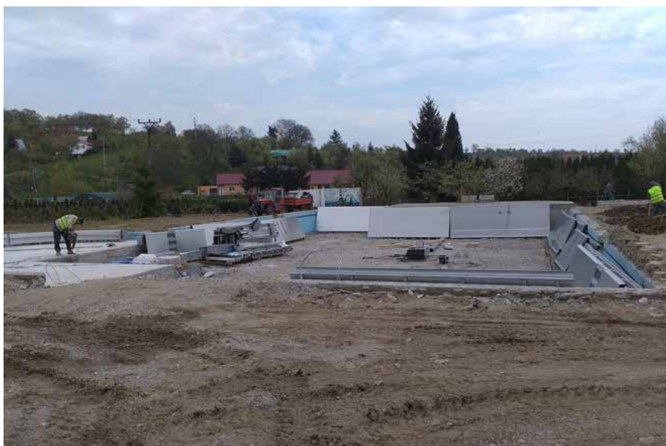
Stavební práce na koupališti