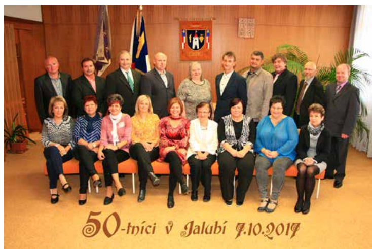
Setkání ročníku 1967 - 7. 10. 2017