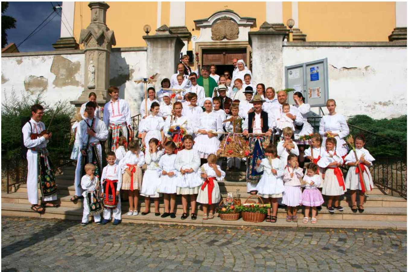
Dožínková chasa před kostelem sv. Jana Křtitele v Jalubí