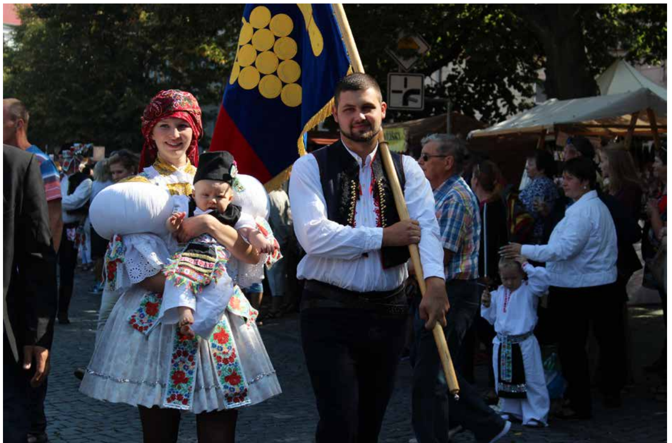
Možná nejmladší účastník letošních slavností vína v Uherském Hradišti