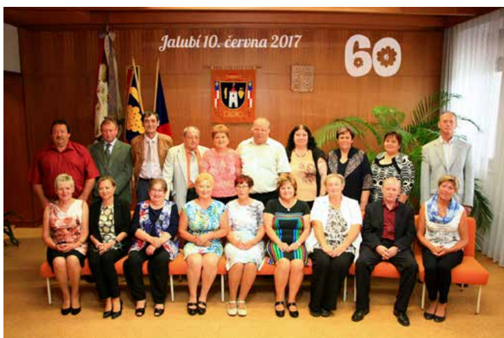
Setkání ročníku 1957 - 10. 6. 2017