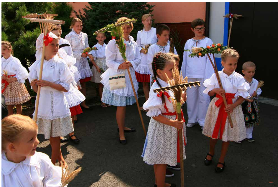
Jalubské děti na dožínkách