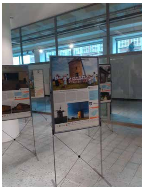
Panel obce Jalubí v soutěži