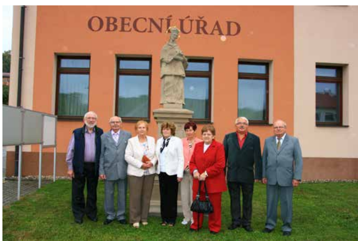
Setkání ročníku 1942 - 16. 9. 2017