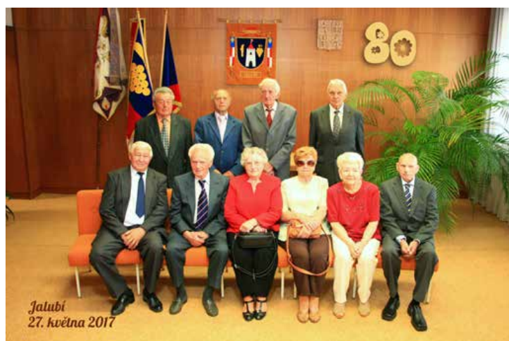
Setkání ročníku 1937 - 27. 5. 2017