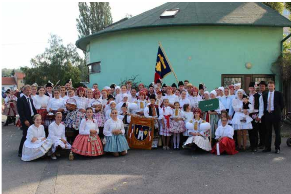
Slavnosti vína 9. září 2017