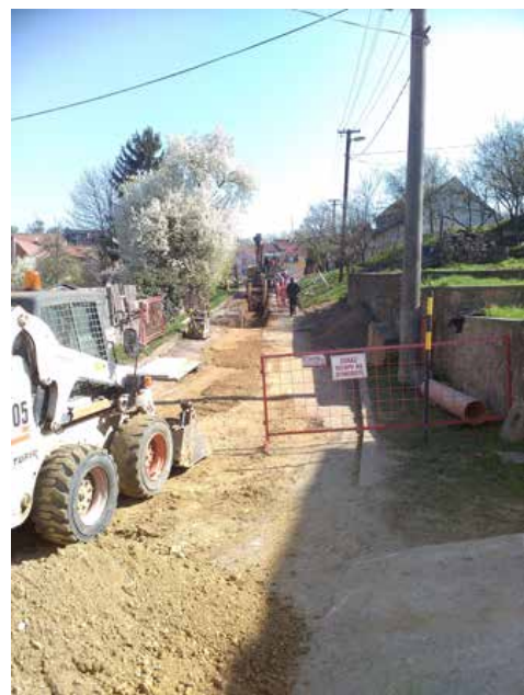
Výměna kanalizace v Hrnčířích